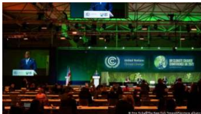
COP26, una cumbre con muy pocos países en desarrollo