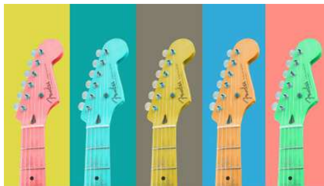
Las mejores canciones sobre el cambio climático y sus consecuencias