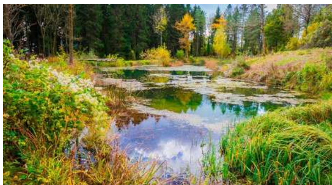
La COP26 se quedó "horriblemente corta", asegura un experto en agua