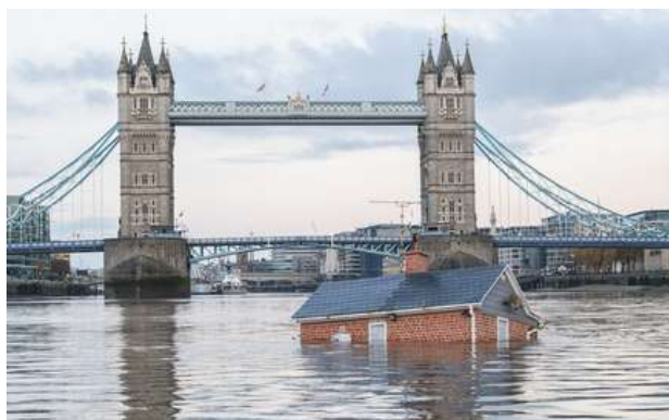
El arte también muestra el cambio climático y sus consecuencias