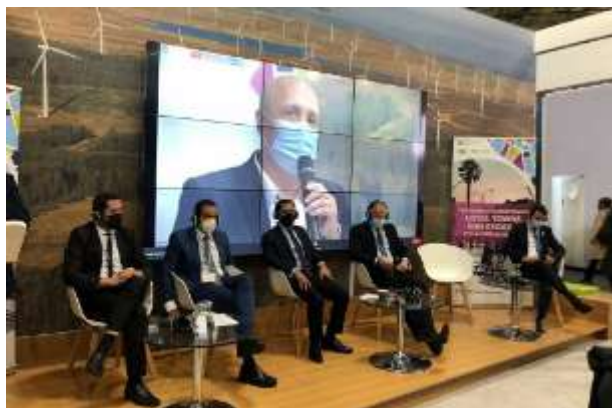
Gobiernos locales: actores fundamentales del inicio de la COP26 y de las sesiones de LGMA